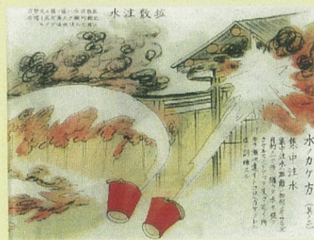
『隣組防空絵解』（大日本防空協会、昭和19年）