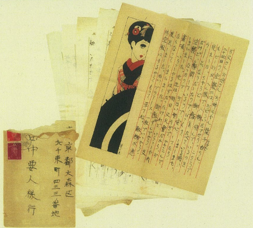
疎開地からの手紙（昭和19年11月25日）

また、疎開が行われるようになった背景、東京都の疎開に関する文書、防空政策などについても合わせて展示し、戦争について考える機会にします。