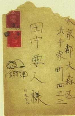
疎開地からの手紙（封筒） （昭和20年1月14日）