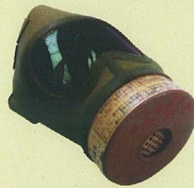
十七年式防空用防毒面 個人蔵