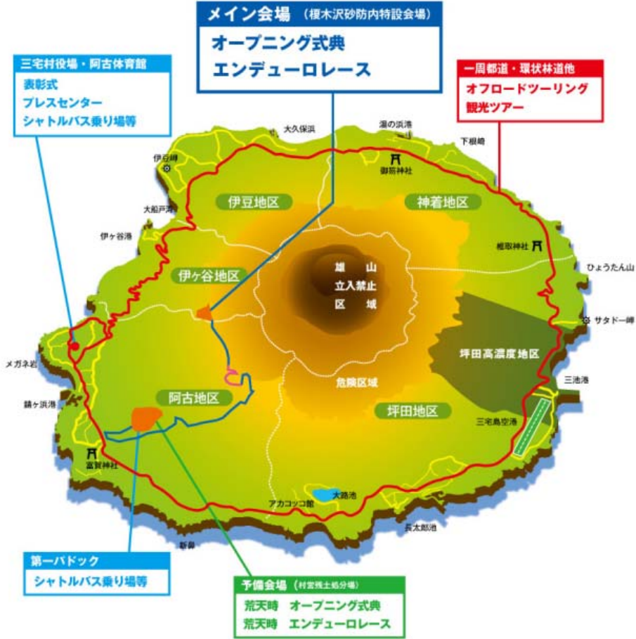
【レースコース図詳細】