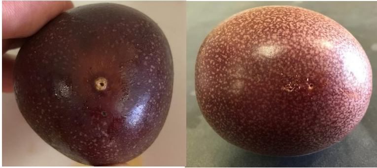
図1 パッションフルーツ果実への穿孔被害 左：果柄部への被害 右：果皮への被害