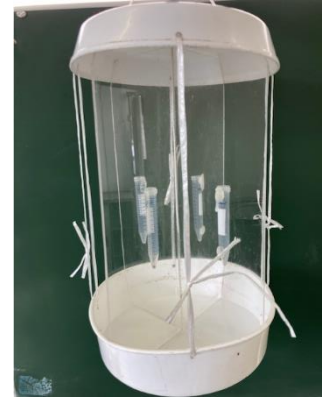
図2 作成した衝突板トラップ