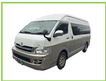
AI デマンドタクシー（坂上地域）