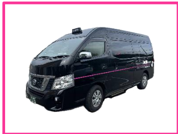
AI デマンドタクシー（坂下地域）