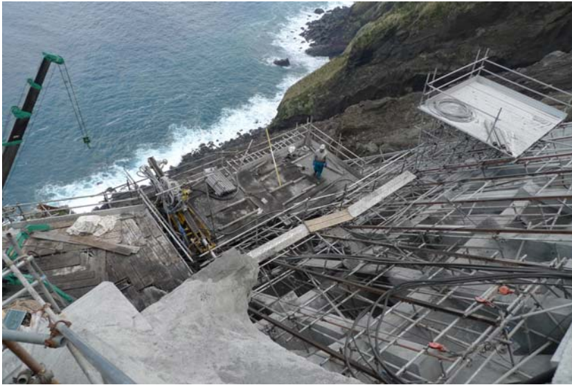
【大千代港の崩落復旧工事】