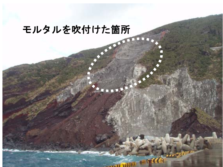
【上手回りの災害防除工事】