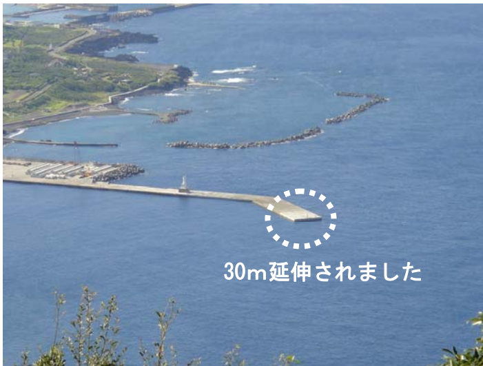
【ケーソン据付により延伸された底土港の防波堤】