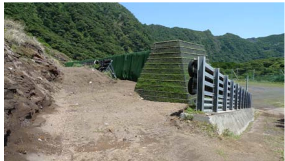
池之沢予防治山（青ヶ島村）

右の写真は、青ヶ島村池之沢地区の予防治山の現場です。池之沢地区では山腹からの落石が多く、道路や電線等の生活基盤が脅かされています。予防治山事業では落石から保全対象を防護するだけでなく、発生源を抑えるための事業も実施していきます。