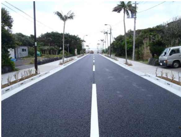
底土通りの歩道改良（八丈町）

青ヶ島村では、中原 2 期の道路拡幅や路面補修、上手廻りの道路災害防除工事を進めていきます。