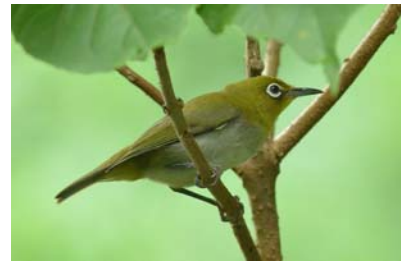
伊豆諸島固有の「シチトウメジロ」

東京都では、メジロなどの野鳥を飼うために捕まえることを認めていません。飼うことも違反行為です。自然のままの姿を観察しましょう。 (産業課林務係 2-1113)