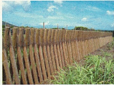
保安林(中浦)の防風・防潮柵