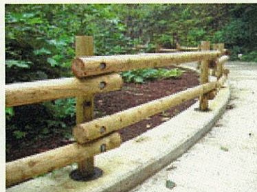
三原林道の転落防止柵

る道をつくっています。特に、人の心を和ませてくれるような温かみのある木材を活用して、周囲の景観とマッチするように心がけています。海辺の林や山の中に設置していますので、探しに行ってみませんか。