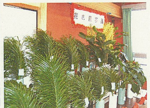
花き園芸品評会の展示会場の様子