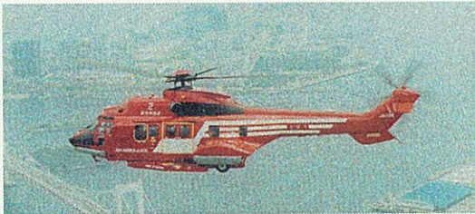
八丈支庁管内の救急患者ヘリコプター要請件数

また、「あおちゅう」の売れ行きが好調で、今年は原料のサツマイモの作付けが大幅に増えています。さらに、「ひんぎゃの塩」や島に古くから伝わる調味料「島だれ」など、新たな商品の開発にも積極的です。