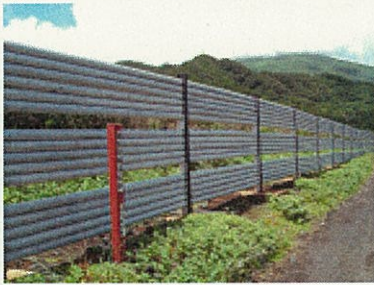
保安林(垂戸)の防風・防潮柵

みなさんは、産業課でも土木工事を行っていることをご存じですか？林務係では、山崩れを復旧したり、海からの風を和らげる防風林を守ったり、森の中へ気軽にアクセスでき