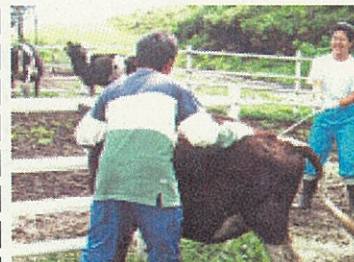
ふれあい牧場での子牛の世話

場八丈分場、ふれあい牧場、八丈ビクターセンター、八丈町立図書館、八丈島空港ターミナルビル株式会社で、各々の業務を実際に体験し、八丈島の産業や組織的な経営などに触れ、識見を広げました。今後の授業に役立てていきます。学校教育の更なる充実を期して、先生も頑張っています。