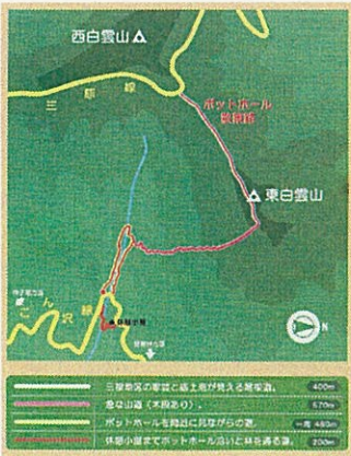
散策路マップ。マップは支 庁ロビーに置いてあります。

入口には、林道や散策路を紹介 する案内板がありますので、お好 きなコースを選んでください。