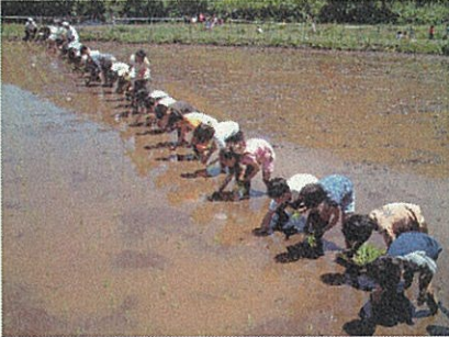
大賀郷小学校児童

5月26日には、大賀郷小学校5年生(約30人)が、初めて田植えを体験しました。先生や保護者たちも手伝い、タニシの駆除や田んぼをならす代掻きをした後、クラス全員が列になつて、慣れない手つきで植えていきました。