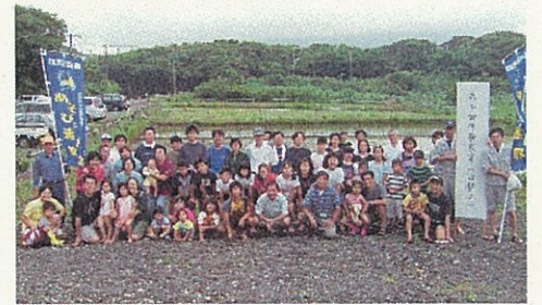
第二回体験農業(田植え)参加者の皆さん

台風の影響で天気心配されましたが、最後まで雨は降らず、末吉小学校のグループや子ども連れの家族が多数参加しました。参加した子どもたちと地域住民(約60人)が、約千平方メートルの田んぼに餅