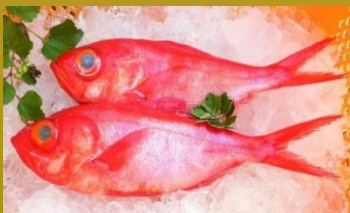
キンメダイ キンメダイ目 キンメダイ科