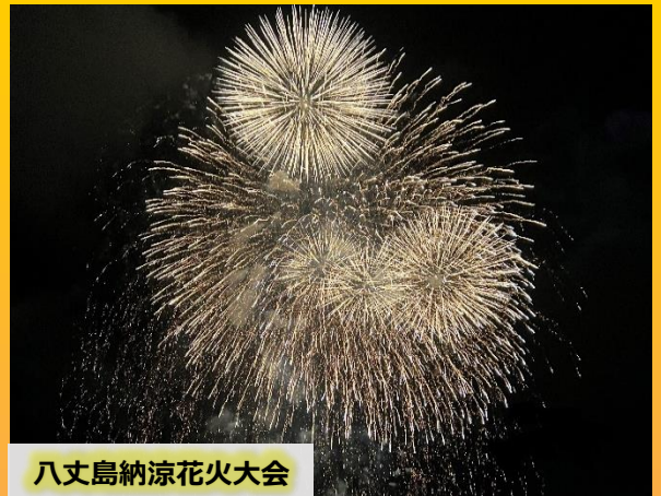
八丈島納涼花火大会

せんげつ にち はちじょうしまのうりょうはなびたいかい ねん かいさい やたい しゅってん 先月11日に、八丈島納涼花火大会が3年ぶりに開催されました。屋台の出店などはありませんで おとし しんがた かんせんかくだい えいきょう ちゅうし ひさ はな したが、一昨年から新型コロナウイルス感染拡大の影響のため中止になっていたため、久しぶりの花 びたいかい しまひと おおもあ 火大会に島の人たちは大いに盛り上がりました！