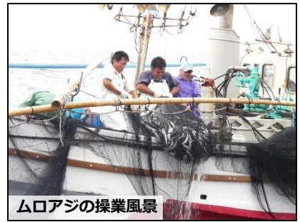
ムロアジの操業風景

まいとし がつ りょう かいし ことし さかな む 毎年8月からムロアジ漁が開始されますが、今年は魚の群 かくにん りゅう りょう かいし れが確認されないなどの理由からまだ漁が開始されていま いま おも ぎょかく そこうおいっぼんづ りょう ん。今は主に、キンメダイなどを漁獲する底魚一本釣り漁が おこな 行われています。