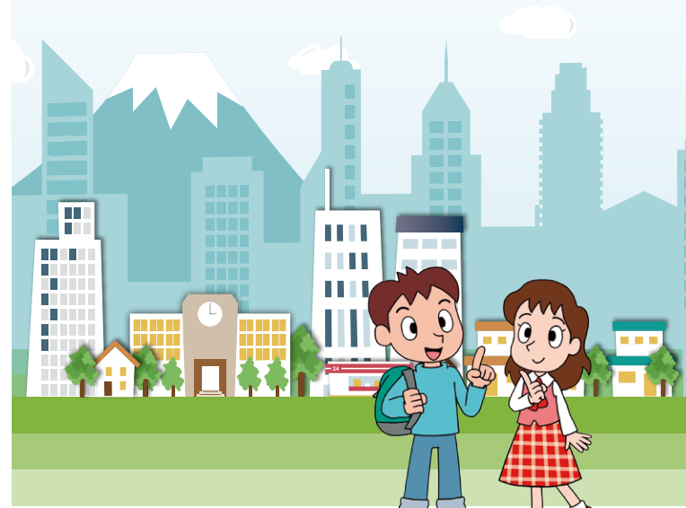
ヒトミとケンタが「人権プラザ」を訪ねてみました。どんな施設なのかな？

人権について楽しく体験して学べる展示室、セミナールームや図書資料室などがあります。人権に関する相談も受け付けています。