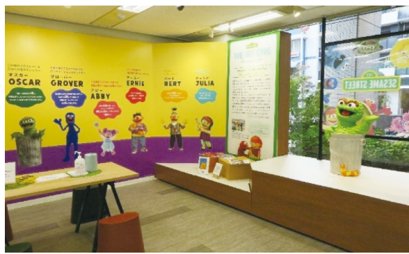
TM and © 2024 Sesame Workshop