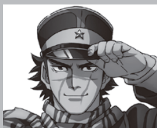
すぎもと さいち 杉元 佐一

杉元、アシリパらは、それぞれの思いを遂げるため、鶴見陣営、土方陣営とともに埋蔵金の在り処を記した「刺青人皮」争奪戦を繰り広げる。