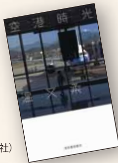
『空港時光』(温又柔著、河出書房新社)