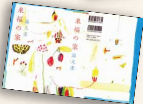
『来福の家』(温又柔著、集英社) *現在、白水Uボックスで刊行中。(裏面参照)