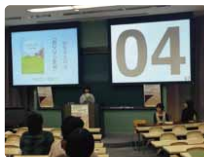
ビブリオバトルの様子

登壇者5名が各5分間で、自身で選んだ本を紹介する。それぞれの発表後に2~3分程度のディスカッション(質疑応答)をへて、参加者全員が1人1票ずつ投票し、最多票を集めたものを「チャンプ本」として決定する。