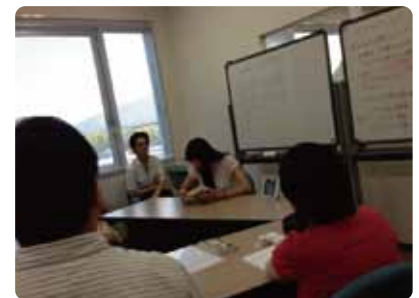
ビブリオバトルの様子

電話 03-6722-0123 ホームページ http://www.tokyo-hrp.jp/