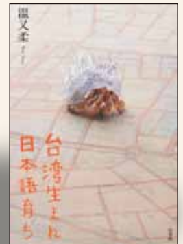
『台湾生まれ 日本語育ち』(温又柔著、白水社) Uブックス『来福の家』(温又柔著、白水社)