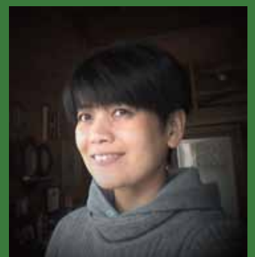
写真:どいかやさん

〒105-0014 東京都港区芝2-5-6 芝256スクエアビル1・2階 電話：03-6722-0123 FAX：03-6722-0084