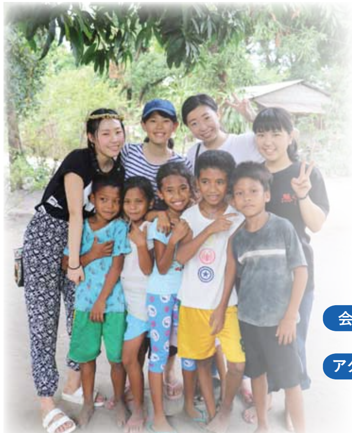
フィリピン・スタディツアーに参加した日本の中高生と支援先の子どもたち

会場内に、絵本『はじめまして、子どもの権利条約』(監修:川名はつ子、2017年、東海教育研究所)の挿絵を描いたスウェーデン画家・チャーリー・ノーマンのイラストパネルと条文を紹介するコーナーもあります。