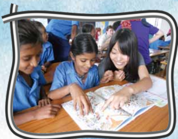
インド・スタディーツアーに参加した中学生と支援先の子どもたち