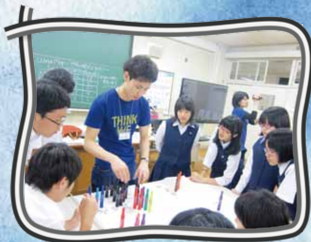
高校生メンバーが日本の学校を訪問して行ったワークショップ