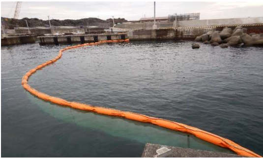
（神津島港 設置状況）

神津島港においては令和3年11月18日に1か所、三浦漁港においては11月21日～22日に3か所と計4か所設置しました。