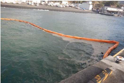
（漂流してきた軽石）

予測どおり軽石は漂着し、漂着した軽石については、玉網にて随時撤去を行っています。