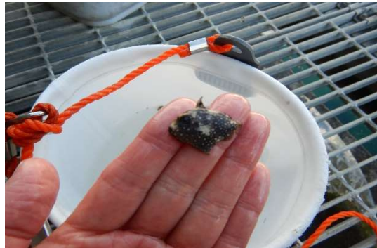
（軽石と一緒に運ばれてきたアミモンガラの幼魚）