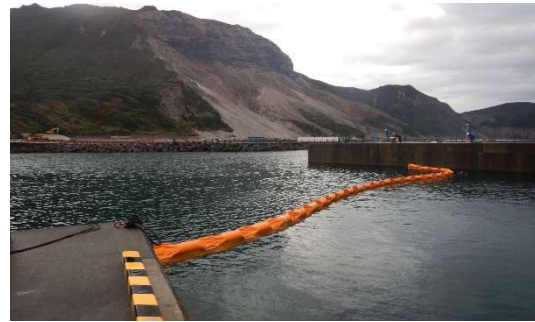
（三浦漁港 設置状況）

予測どおり軽石は漂着し、漂着した軽石については、玉網にて随時撤去を行っています。