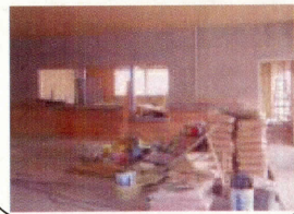
東海汽船 受付カウンター