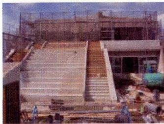
屋外階段（観覧ベンチ）