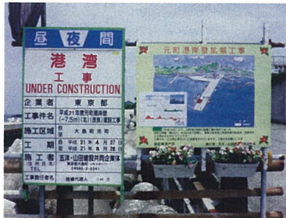
完成予想図・看板・花壇