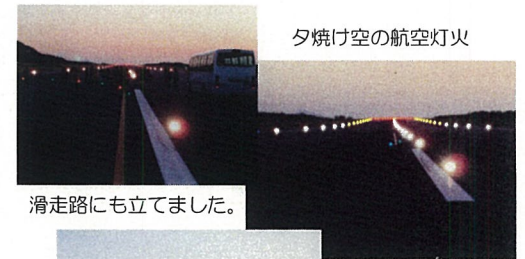
夕焼け空の航空灯火

※ マイクロバスを貸与していただいた大島町役場様をはじめ、運営のお手伝い・記念品の提供等、見学会にご協力をいただきました各関係機関の皆さまには厚く御礼申し上げます。