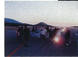
滑走路にも立ってました。