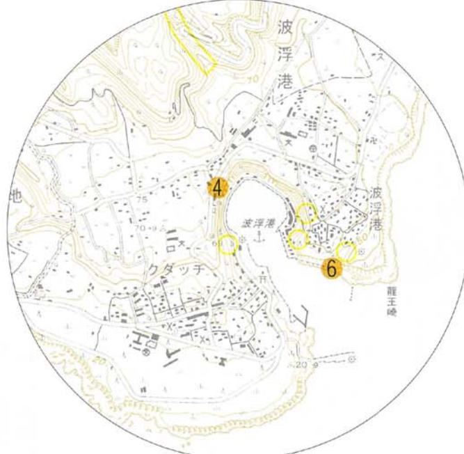
波浮港周辺拡大図 1:25,000