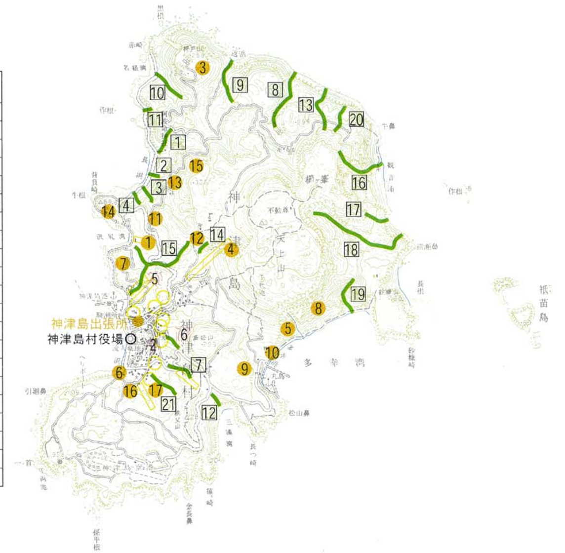
神津島港周辺拡大図 1:25,000