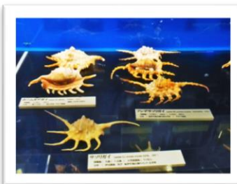
たくさんの種類の珍しい貝 Many kinds of rare seashells