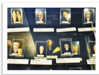
毒のある貝 poisonous sea shells