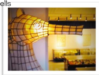
貝を使った作品などの展示 Displays of seashell works and so on.