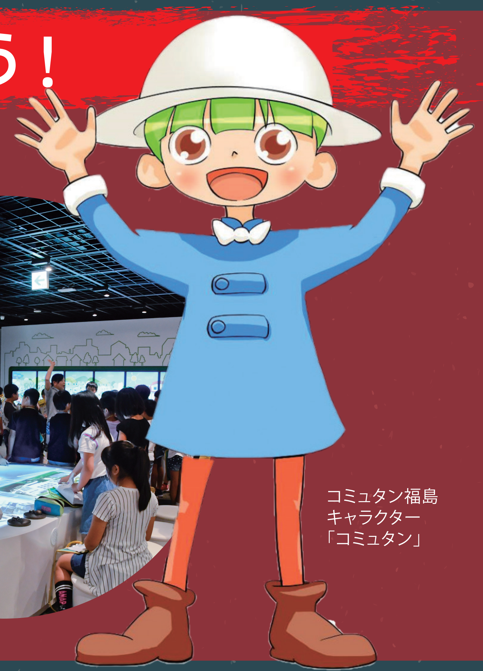
コミュタン福島キャラクター「コミュタン」