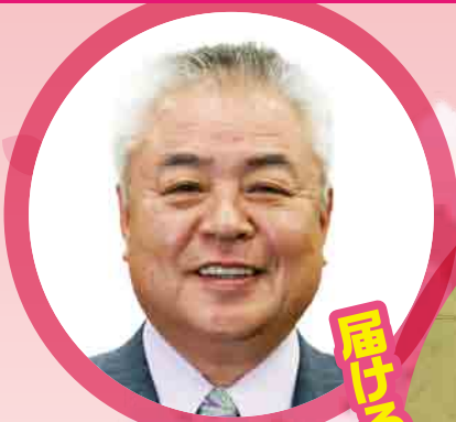
柳本晶一 (元バレーボール全日本女子監督)