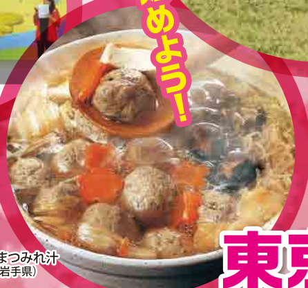
さんまつみれ汁 (岩手県)