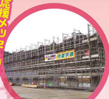
災害公営住宅 (福島県いわき市)