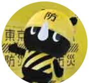
防サイくん(東京都)

29日(金)ホールB5(5F)で開催するステージイベントは、事前申込みが必要です。(定員300名)