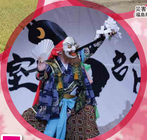
大室南部神楽 (宮城県)