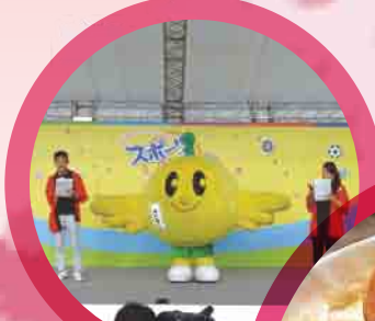
キビタン (福島県復興シンボルキャラクター)