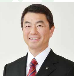
宮城県知事 村井嘉浩