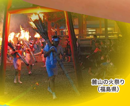
麓山の火祭り (福島県)