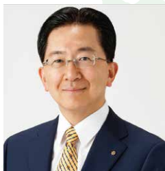
岩手県知事 達増拓也