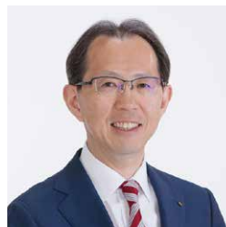
福島県知事 内堀雅雄