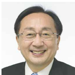
青森県知事 三村申吾