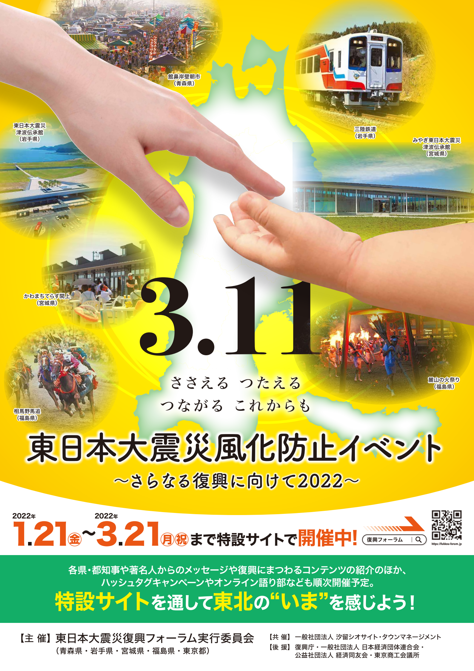
館鼻岸壁朝市 (青森県)