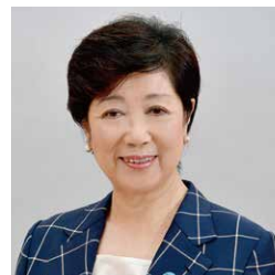
東京都知事 小池百合子