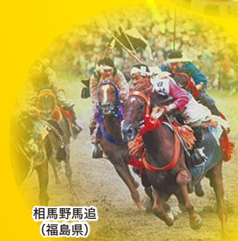
相馬野馬追 (福島県)