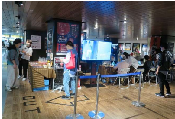
福島産直市の2日間では、DX体験企画を実施。銀座会場とコミュニティ福島（福島県）をリアルタイムでつなぎ、来場者がコミュニティ福島に配置したロボットを遠隔操作し、モニターを通じて展示を見学しました。