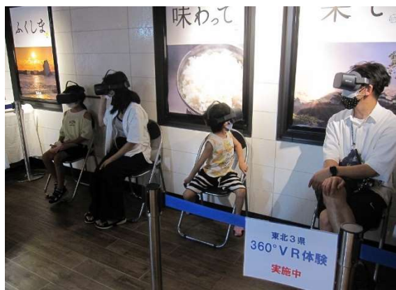
360度VR映像により東北の今を体験できるVR体験コーナーを設けました。