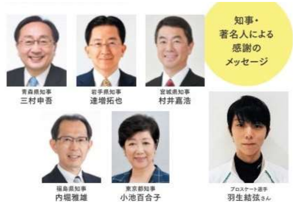
知事・東北ゆかりの著名人による感謝のメッセージ動画