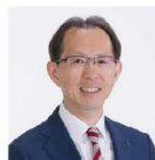
福島県知事 内堀雅雄