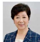
東京都知事 小池百合子