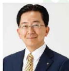
岩手県知事 達増拓也