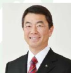
宮城県知事 村井嘉浩