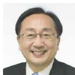
青森県知事 三村中吾