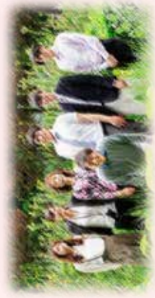
医療ネットワーク支援センター スタッフ