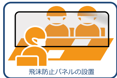
飛沫防止パネルの設置