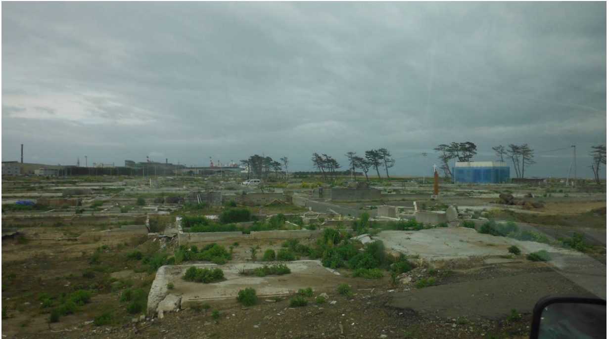
移転促進区域（買取り対象地） 蒲生北部地区 平成 24 年5月撮影