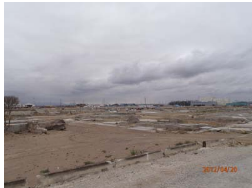
建物が流され基礎のみが残っている沿岸部

仙台市は今回の震災で、沿岸部では津波により約12,000棟の建物が流出又は浸水、丘陵部では地すべりや擁壁崩壊等の被害を受けました。私が派遣された復興まちづくり部は、主に沿岸部の津波被災地に関連する事業を担っていました。