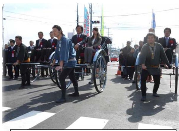
主要地方道気仙沼唐桑線（県道26号線） 本町橋開通式で人力車を引く様子

また、気仙沼のイベントにも積極的に参加し、お祭りで神輿を担いだり、橋梁（本町橋）の開通式では市議会議員や市民の方々を乗せて人力車を引いて渡り初めを行ったりと、地元の方々とのコミュニケーションを積極的に図ることを心がけました。地元の方々とのふれあいの中で気仙沼市民の復興に対する熱い意気込みを強く感じ、私たち派遣職員の仕事への活力となりました。