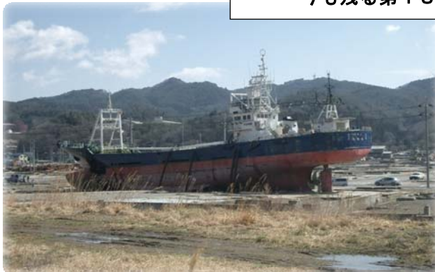
今も残る第18共徳丸（鹿折唐桑駅前）

また、今回の鹿折地区土地区画整理事業施行区域内の鹿折唐桑駅前にも津波により流出した第18共徳丸（下添写真）が未だに残っており、保存と解体で賛否が問われています。