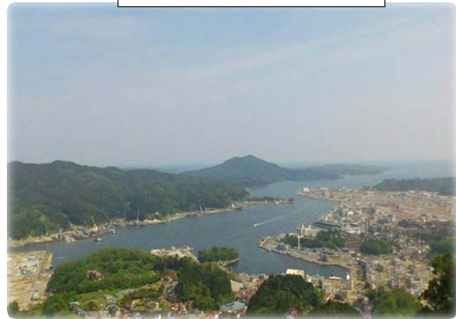
安波山から望む中心市街地

約一週間の派遣業務はあっという間で、「被災地のために本当に自分が役立てたのか」、「被災地復興のためにもっと働きたい」という思いが日に日に強くなりました。このことをきっかけに、その年の異動申告時期に被災地への長期派遣を志願し、宮城県気仙沼市への派遣が実現しました。期間は平成24年4月1日から平成25年3月31日までの1年間、気仙沼市建設部都市計画課土地区画整理室で派遣業務に従事しました。