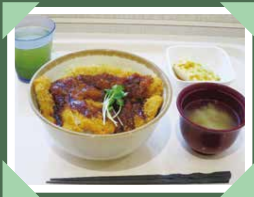
会津若松名物「ソースかつ丼」 東京都復興応援ランチ (※) より

会津若松市は、鶴ヶ城や白虎隊に代表される歴史・伝統・文化が息づくとともに、磐梯山や猪苗代湖など豊かな自然に恵まれた都市です。