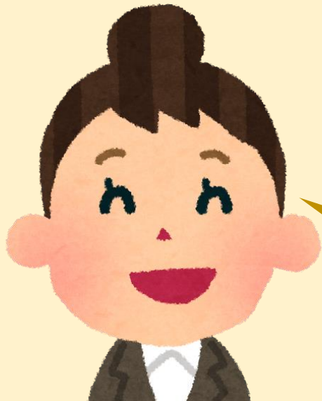
内部統制担当 S主任