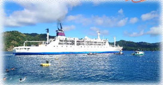
定期船「おがさわ丸」

東京から南へ約1,000km離れた小笠原諸島。内地と小笠原を結ぶ唯一の交通手段は、概ね6日に1便、東京の竹芝桟橋から片道24時間かけて運航される定期船「おがさわ丸」、通称「おが丸」に限られています。小笠原諸島で人が住んでいる島は父島と母島の2島ですが、ここでは赴任場所となる“父島”を中心にくらしと魅力を紹介します。