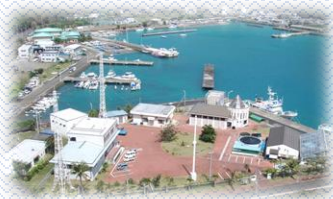
水産センター全景