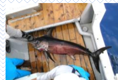
漁獲したメカジキ

興洋による試験操業を経て、ソデイカ漁法を導入するとともに、さらにこれを改良し、メカジキやマグロも漁獲する漁法を開発しました。小笠原漁業の現在の主力はこの漁法で獲れるメカジキです。