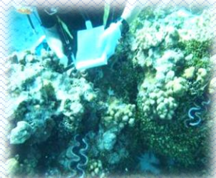
沖ノ鳥島の資源調査

基本的には日帰りです。調査の場所や内容によって異なりますが、午前8時頃に出港、午後4時過ぎに帰港し、その日の片付け、次の日の調査の準備をした後、解散となります。年2回予定されている沖ノ鳥島調査、漁協の依頼による硫黄島列島周辺海域の調査などの場合は、数日にわたる宿泊を伴う航海となります。